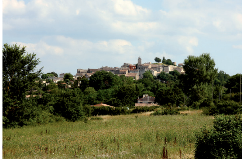
Vue du village